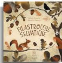
Gerardo Attanasio Bianca De Magistris «Filastrocche selvatiche» Storiedilchi pp. 40, € 14,90