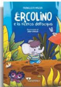
Francesca Mazza «Ercolino e la ricerca dell'acqua» Sanpino pp. 40, € 12,50

«Per il bosco solo solo/ trotterella il capriolo./ raffinato saltatore./ che eleganza, che splendore!/ »