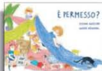
Elena Rossini Irene Penazzi «È permesso?» Camelozampa pp. 32, € 18