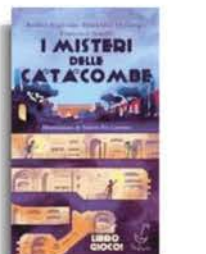
Andrea Angiolino Domenico Di Giorgio Francesca Garello «I misteri delle catacombe» Parapiglia pp. 288, € 14

Rosso e bruno tutto il pelo./ con il muso tocca il cielo». È dunque il piccolo, agilissimo cervide, a fare da battistrada lungo l'itinerario naturalistico tracciato da Gerardo Attanasio nell'album Filastrocche selvatiche . Le sestine, in rima baciata, raccontano ai piccini i comportamenti connotati di sedici animali nei rispettivi habitat e le illustrazioni di Bianca De Magistris li invogliano intanto a un primo incontro con la talpa, che sbucca dalla galleria appena scavata in campagna. Inoltre con la volpe che, di vedetta su un grosso ramo al limitare del bosco, punta il pollaio sulla collinetta lì di fronte. E con l'anatra, che mostra ai suoi anatroccoli come pescare in un laghetto di montagna.