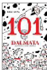
DODIE SMITH 101 DALMATA (camelozampa) La carica dei 101 prima di Walt Disney