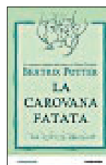
BEATRIX POTTER LA CAROVANA FATATA (Mondadori) Un inedito della leggendaria autrice di Peter Coniglio