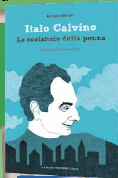
Calvino, Lo scoiattolo della penna di Giorgio Biferali (La Nuova Frontiera)

Perché quest'anno ricorre il centenario della nascita di Calvino, quindi biblioteche e scuole organizzeranno iniziative, maratone di lettura, laboratori, concorsi... Perché non metterti avanti con il lavoro e fare un figurone?