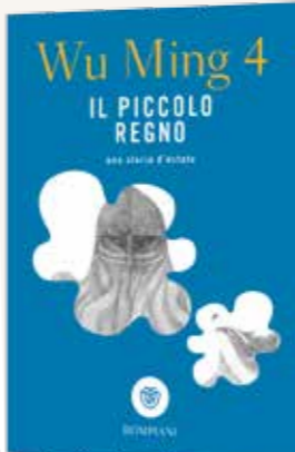
Wu Ming 4 IL PICCOLO REGNO-UNA STORIA D'ESTATE (Bompiani, 240 pagine, 14 €)

sopraffare il bene, il valore dell'amicizia e dell'amore quando tutto sembra perduto. L'importanza di adulti che siano ancora in grado di parlare ai ragazzi.