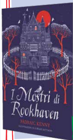
Pádraig Kenny I mostri di Rookhaven EL, 352 pagine, 15,50 €

A nostro parere: Un'ambientazione horror per una storia di formazione che divorerai "mostruosamente" sperando di non arrivare mai alla fine.