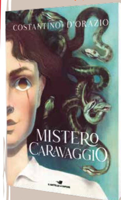
Mistero Caravaggio D'Orazio Piemme, 224 pagine, 16 €