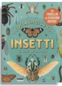
Camilla de la Bédoyère «Insetti e altri Artropodi» Fabbrì pp. 64, €19.90 Dai 6 anni