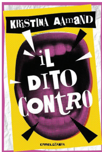
Camelozampa, pp. 228 € 17,90 (da 12 anni)

Nel racconto l'autrice dà spazio a una riflessione sul concetto di integrazione e inclusività e racconta anche la malattia offrendo un punto di vista interessante. Un romanzo Young adult attualissimo, che parla a giovani lettrici e lettori ma anche a chiunque voglia prendere in prestito uno sguardo fresco sul presente e le sue infinite intersezioni.