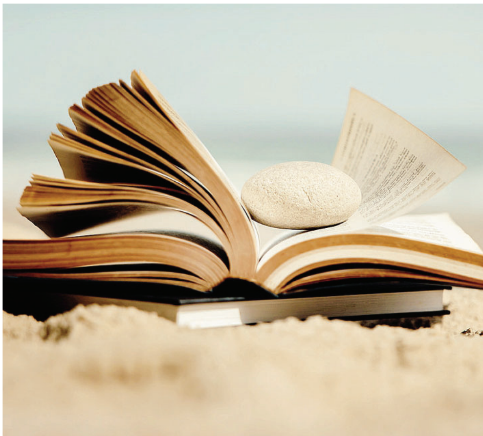
Il meglio delle letture estive per ragazzi segnalate da Carla Colmegna: le copertine dei libri di Thibaut Rassat, Eulàlia Canal ed Erka Casali

Si tratta di una raccolta di racconti scritti da venti tra gli autori più noti di libri per under 18 che riunisce, disegnate da Valentina Gambino, storie di temi tra i più sentiti e condi-