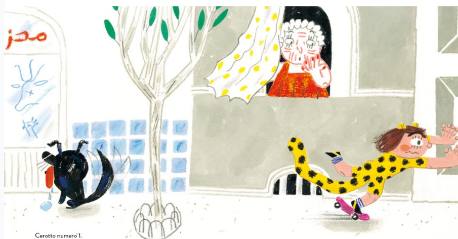
Cerotto numero 1.

Una bambina piena di risorse ci racconta le sue avventure, ricordandole una per una attraverso i cerotti colorati che decorano la sua pelle. Correre con lo skateboard, giocare con un gatto non proprio dolcissimo, cucinare insieme ai nonni, fare il portiere per la squadra di calcio: durante le attività più appassionanti può capitare di farsi male, ma l'importante è continuare a divertirsi e non perdere mai il gusto per l'avventura!