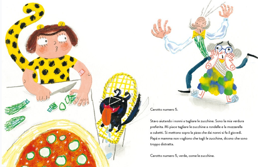
Cerotto numero 5.

Stavo aiutando i nonni a tagliare le zucchine. Sono la mia verdura preferita. Mi piace tagliare le zucchine a rondelle e la mozzarella a cubetti. Si mettono sopra la pizza che dai nonni si fa il giovedì. Papà e mamma non vogliono che tagli le zucchine, dicono che sono troppo distratta.